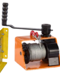
HW-A и GR