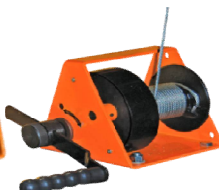
HW-B и VS